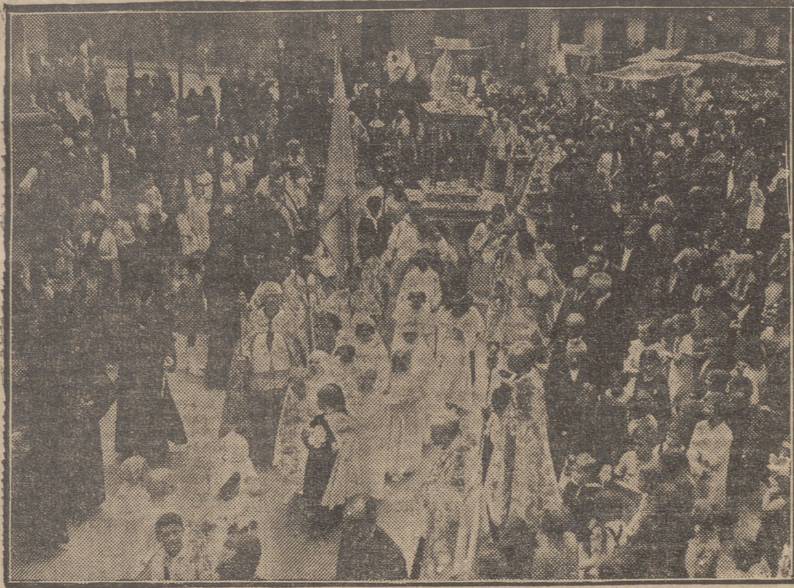
CALAHORRA.—UN ASPECTO DE LA PROCESION DEL CORPUS.