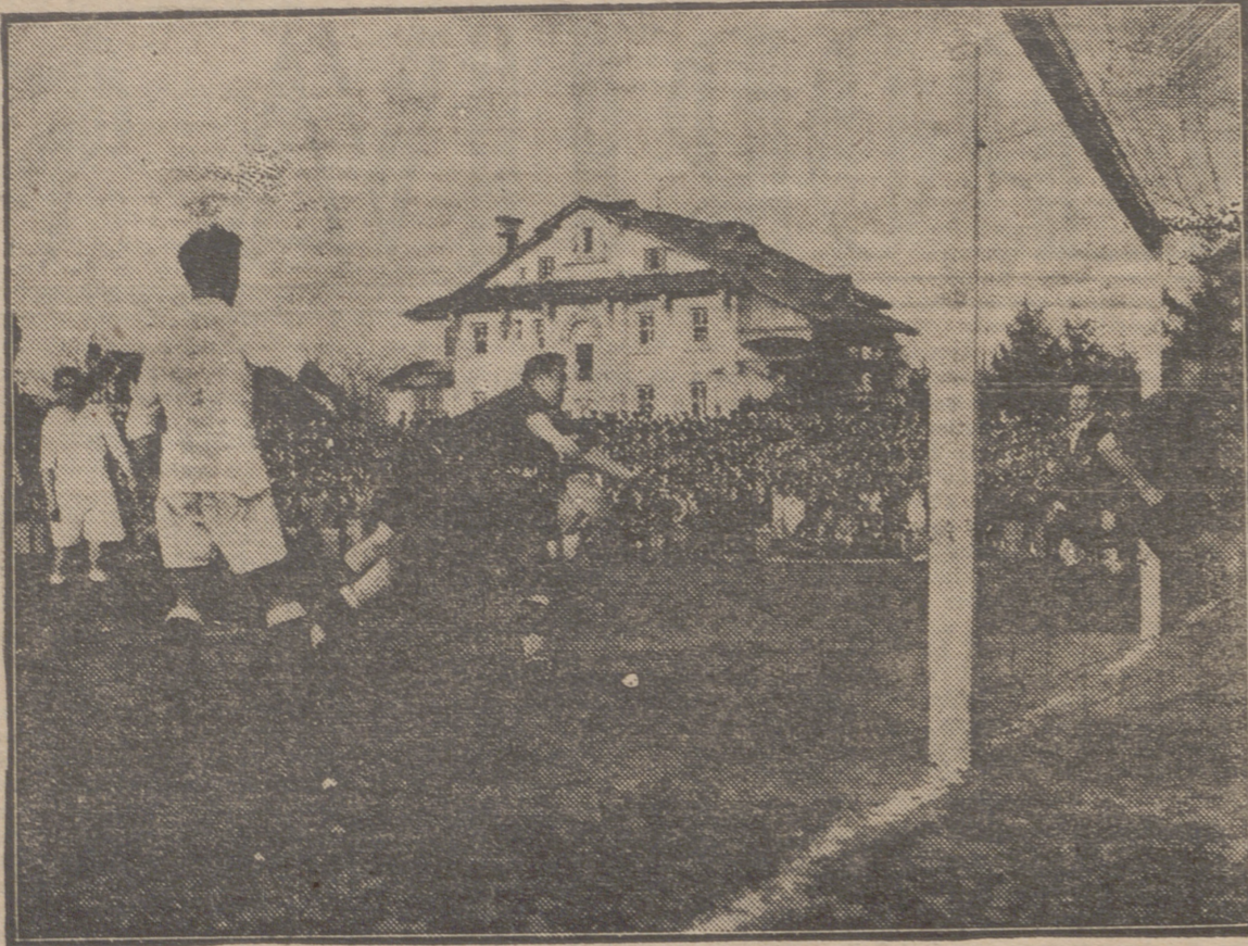
PAMPLONA.—ZAMORA SALVA CON DIFICULTAD UN ACOSO ROJILLO.