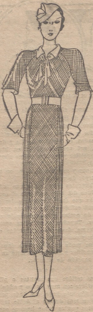
Vestido de lana "violín". Cuello y lazo que lo cierra de piel blanca, así como el cinturón.