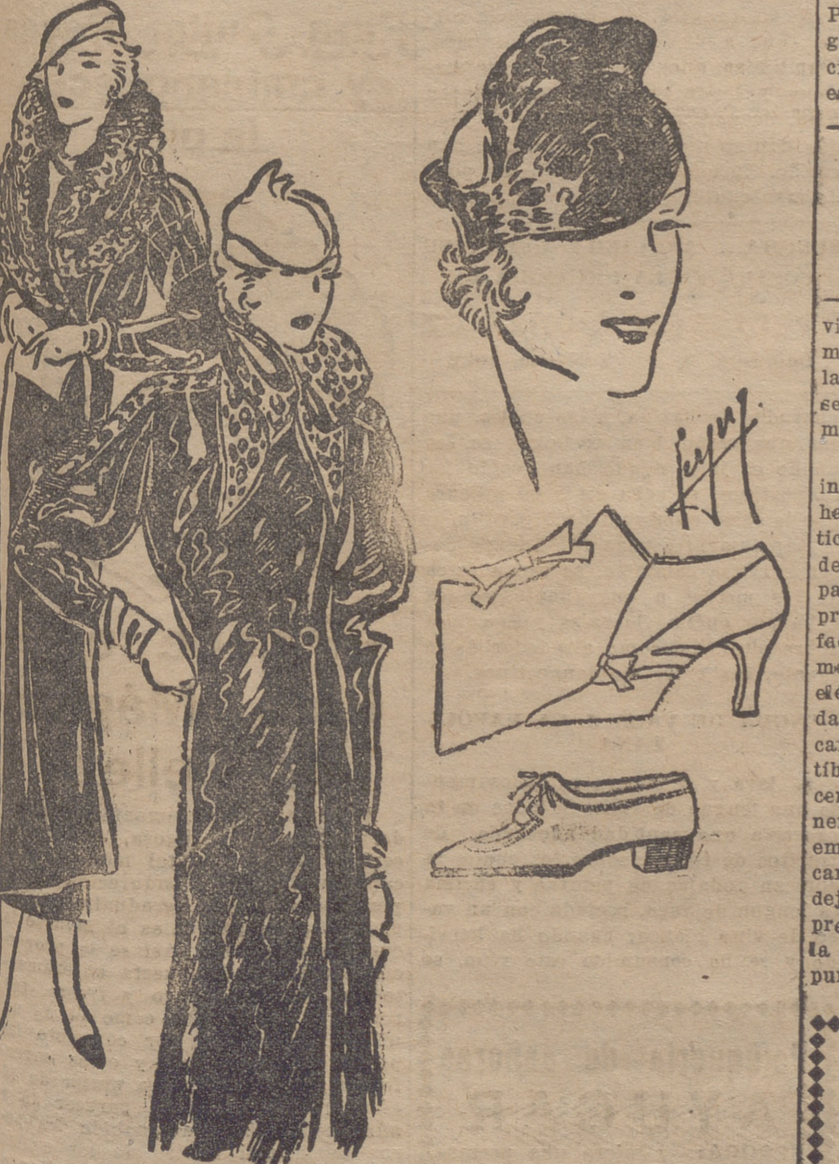
Abrigo de lana negra, adornado con cuello de astrakán. Abrigo tres cuartos, de piel de potro, adornado con "d'ocelot", Zapato y cartera en piel de colores claros. Tocca de breitschwanz para acompañar un abrigo de esta misma piel. El fondo es de terciopelo rojo viejo.

PLAZA ABASTOS, PUESTO, 100-101 Teléfono, 1748