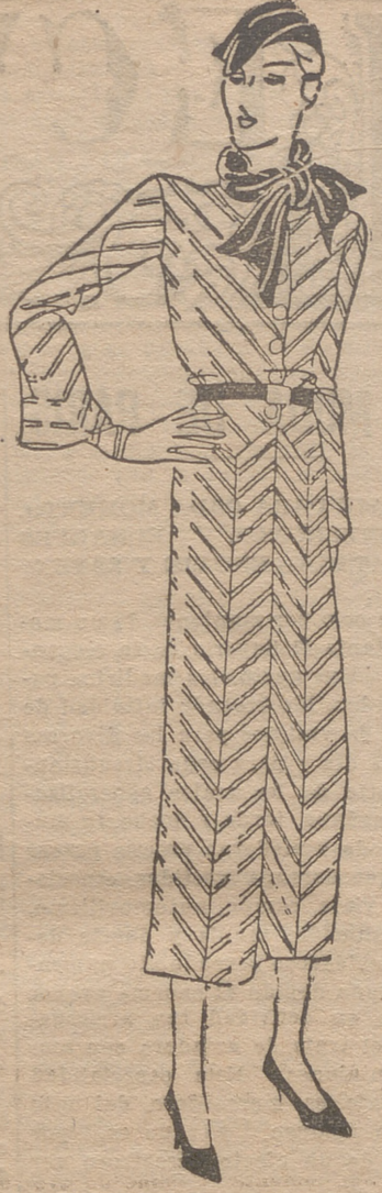
Vestido de lana gris, rayas gris oscuro. Corbata y cinturón de terciopelo rojo. Botones y broche de galalita gris.