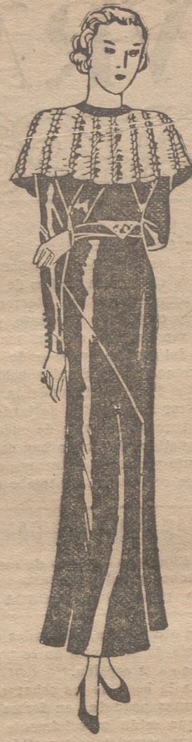
Vestido de terciopelo negro. Capita de terciopelo, blanca y negra. Un motivo de joyería adorna la cintura.