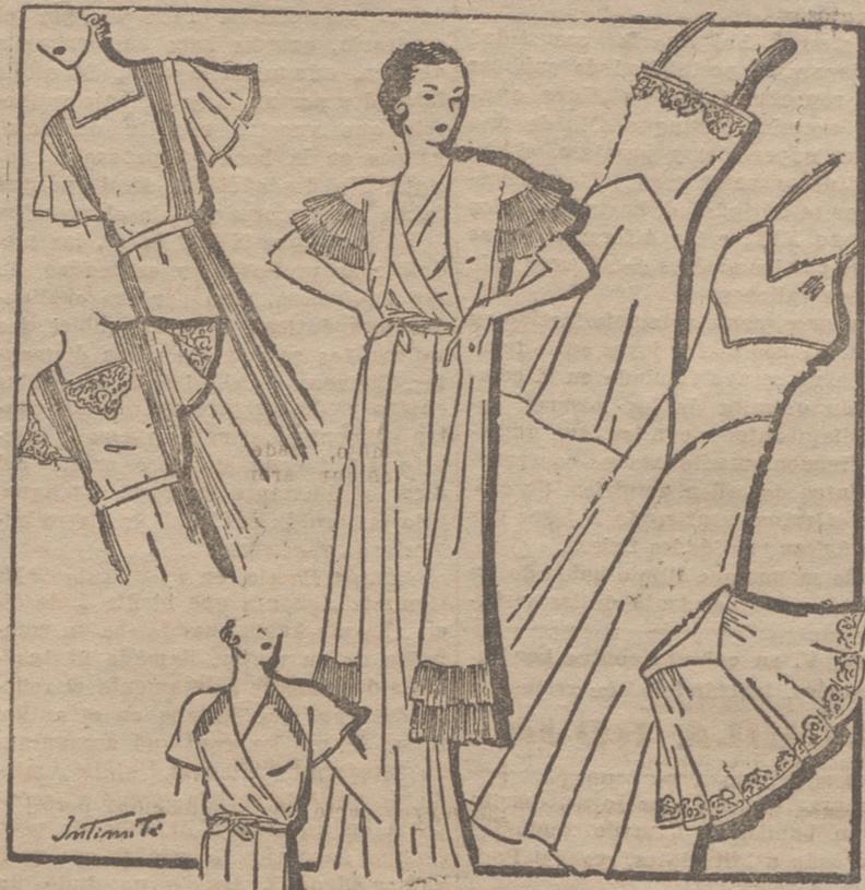
"Deshabille" de "crepé" de china, adornado con volantes plisados. Camisa de noche de "crepé" satén, con alforcitas. Camisa de noche, de batista, adornada con aplicaciones y alforcitas. Camisa y calzón, de batista de hi lo, adornados con encaje.

Los vestidos de encaje se llevan en las grandes fiestas de noche, de corte muy ajustado al cuerpo y amplio en los bajos de las faldas, con vuelo sobre las caderas; el escote en forma de