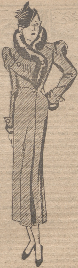
Abrigo color rojo. Cuello bordeado de "skung" negro. Dicha piel se encuentra también en los puños.