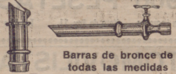
Barras de bronce de todas las medidas

GRIFOS Y ACCESORIOS PARA BODEGAS Grande existencias :: Precios sin competencia Miguel Hornillos General Espartero, 16 ::: Teléfono, 1460 COMPRO A BUEN PRECIO TODA CLASE DE METALES