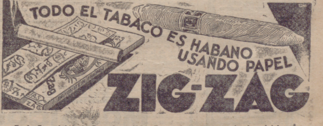
En la Exposición de Barcelona 1929. Fuera de concurso, miembro del jurado