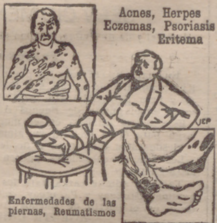
Enfermedades de las piernas, Reumatismos