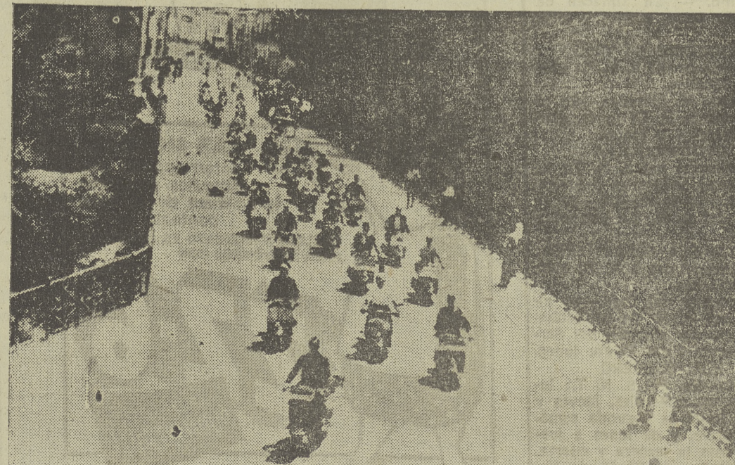
Por el puente del Duero, en Aranda, pasan los «vespistas» camino de Burgos.