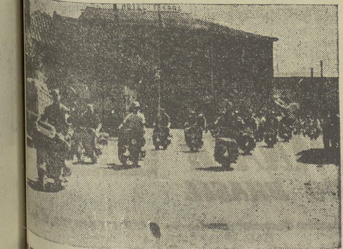
Participantes de la columna amarilla a su paso por Aranda de Duero.

En estas mismas columnas se dio a su debido tiempo una serie de informaciones y noticias referentes al II Rallye «Vespa» al Mar Cantábrico, una magnífica prueba deportiva que precisamente en esta ciudad tuvo un éxito extraordinario, causando a la vez un espectáculo grandioso que destiló por nuestras calles las doscientas cincuenta máquinas, silenciosas y rápidas, recorriendo un extenso circuito, donde varias de burgaleses han escogido posiciones para presenciar aquella cabalgata. Sin ningún género de dudas, este acontecimiento deportivo ha constituido la prueba más grandiosa celebrada hasta la fecha en nuestra Patria. El II Rallye «Vespa» al Mar Cantábrico se desarrolló durante los días 8, 9, 10 y 11 del presente mes, y ha sido organizado por el Vespa Club de España, presidido por el coronel de Aviación don Luis Serrano de Pablo, quien ha puesto en esta gigantesca empresa un entusiasmo admirable y un fervor unánime conduciendo al éxito lo todo con la aportación de los «vespistas» de toda España e incluso del extranjero, donde hay que des-