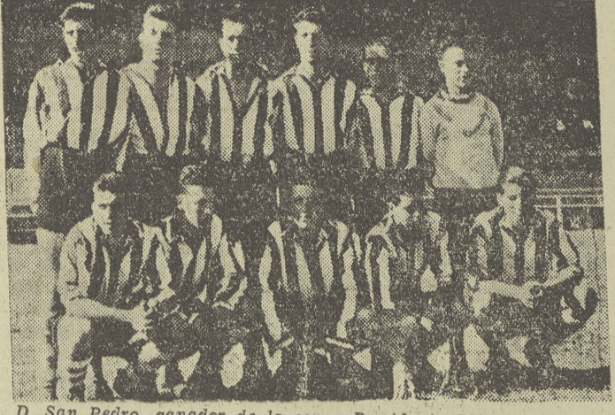
C. D. San Pedro, ganador de la copa «Presidente Burgos C. F.», proclamándose campeón ayer después de su último partido.

Los resultados de ayer San Pedro, 2; San Esteban, 1. El San Pedro se proclama campeón del torneo.