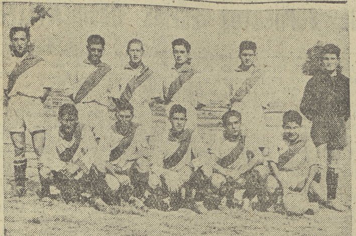
Jugadores del C. D. Rayo.

El nuestro corresponsal Francisco... El domingo, excursión al pantano de la Sierra y la Laguna Negra. En ambos sitios, aquellos que acudan lo pasarán maravillosamente, y serán muchos los que, a pesar de haber ido otras veces en años anteriores, vuelvan este año a recordar la grandiosa impresión que produjo en su ánimo el primer viaje que le llevó a tales parajes, y por lo tanto, no es de extrañar que a la hora que aparecen estas líneas en nuestra sección de LA VOZ DE CASTILLA sean muchos los billetes que se han expedido para esta excursión, por lo que debes de apresurarte a proveerte del tuyo si quieres gozar de un día que dejará en tu ánimo un recuerdo imprecdero.