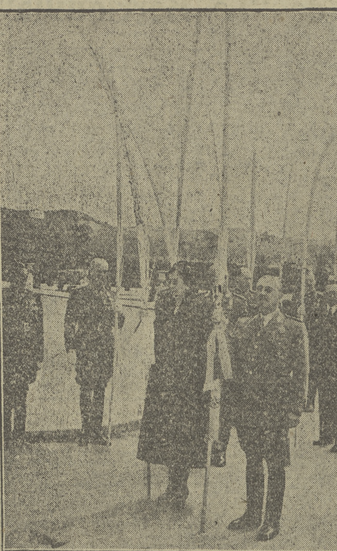
El Caudillo y su esposa durante la procesión del domingo por los jardines del Palacio de El Pardo.