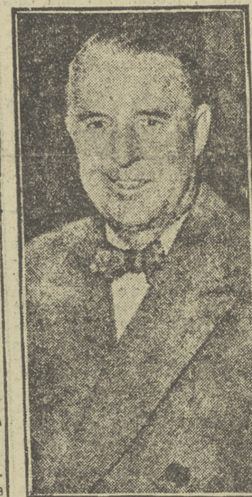
El señor Abbot, ministro de Hacienda en el Canadá, que en estos días visita España.