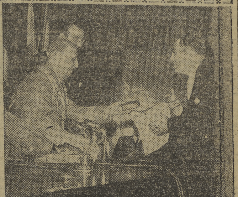
El Caudillo durante el acto celebrado en el Consejo Superior de Investigaciones Científicas, con motivo de la Fiesta de la Hispanidad, en el momento de entregar el título de socio de honor al ministro de Educación del Ecuador

está hoy en el período que recuerda las más crueles persecuciones, poniendo de relieve el sacrificio de los misioneros, diciendo que, a pesar de todo, la palabra de Dios no está encadenada. (Efe).