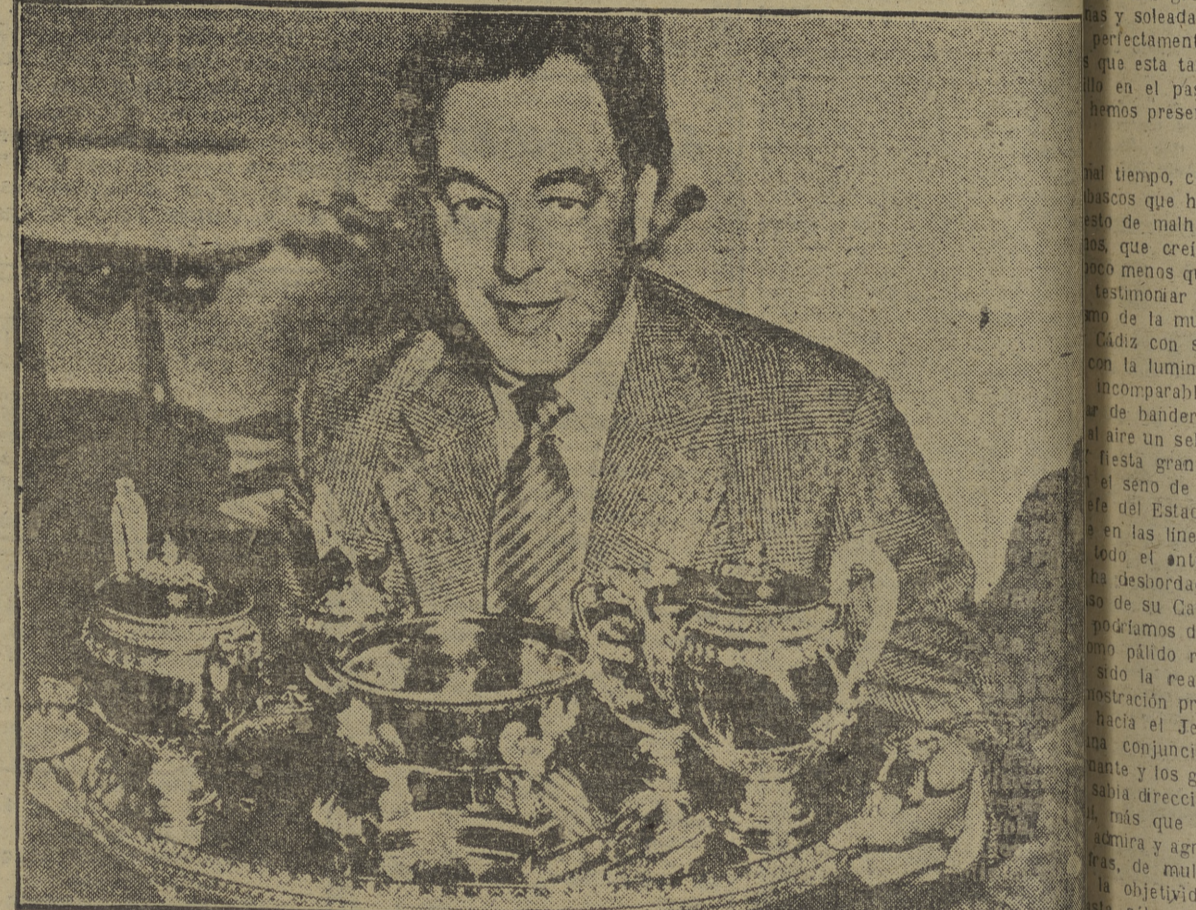
He aquí el juego de café y té, valorado en una suma equivalente a cuatro millones de pesetas, ha sido vendido en Estocolmo. Perteneció al zar de Rusia y fue realizado en 1825 por el famoso orfebre ruso Kleber. Es de oro macizo y pesa diez kilos.