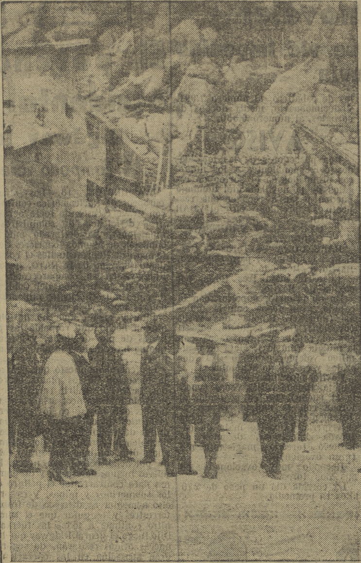
Los Jefes de Estado de España y Portugal visitan el Valle de los Caídos

(Viene de primera página) El ministro de Obras Públicas, el general de Arquitectura, y el arquitecto director de las obras, en primer lugar se dirigieron a la gran sala de la iglesia, desde donde contemplaron la gigantesca cruz que mide sesenta metros de altura y que tendrá cincuenta cuando esté terminada, y después pasaron a una sala del Monasterio, construido al pie del risco de la Nava, que será sede del culto y cuidado del monumento. En dicha sala examinaron las maquetas del monumento y los planos de las pinturas murales que serán adornadas. Después visitaron la biblioteca, la sala de conferencias, capilla y celdas del Monasterio, así como la hospedería que se destina a los peregrinos.