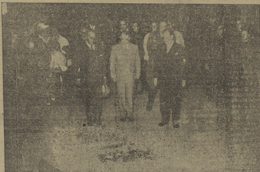
ANTE LA TUMBA DEL FUNDADOR El Generalísimo Franco y el presidente Craveiro oran ante la tumba de José Antonio, durante su visita al monasterio de El Escorial