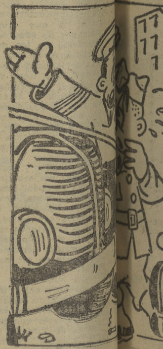
—¿Y a esto le llaman...