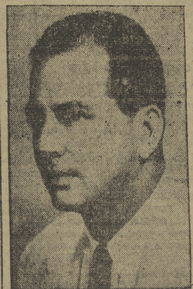
EL VICEPRESIDENTE DE PANAMA Don Ricardo Arías Espinosa, vicepresidente de la República de Panamá y ministro de Trabajo y Previsión Social, que se encuentra en Madrid invitado por el Gobierno español.