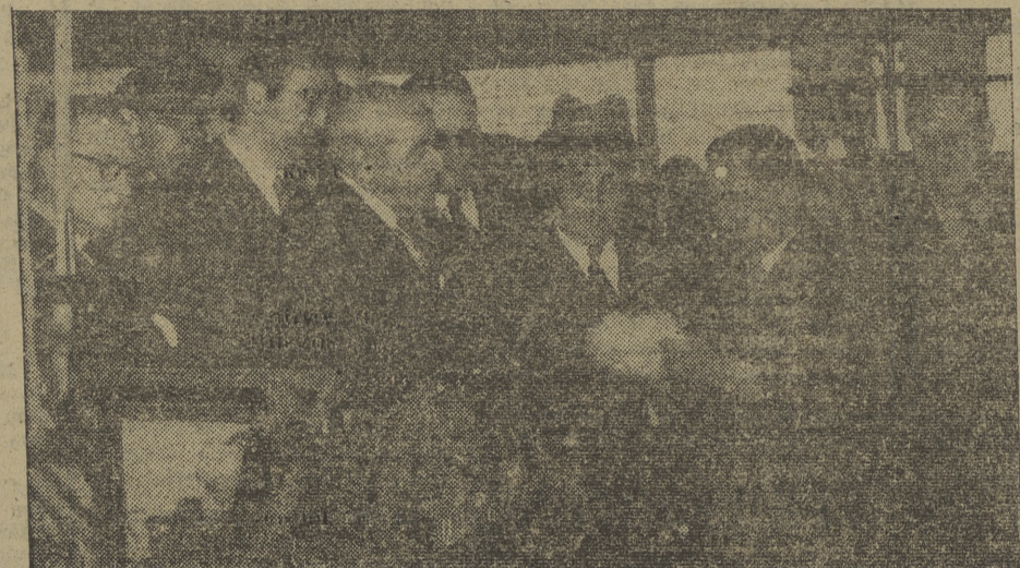
El Caudillo durante su visita a las factorías "Hytasa".