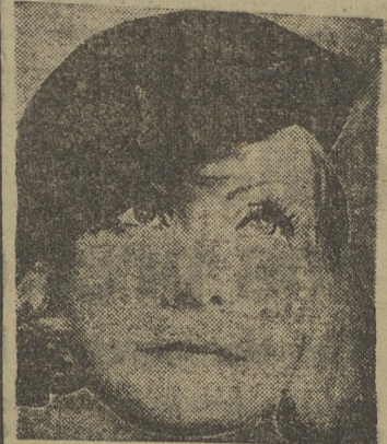
Greta Garbo está en Hollywood.

Llegó envuelta en ese aire de misterio que arrastra por el mundo desde hace años y no permitió que la retrataran ni quiso hablar con los periodistas.