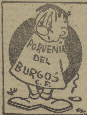
"Negro es mi color"