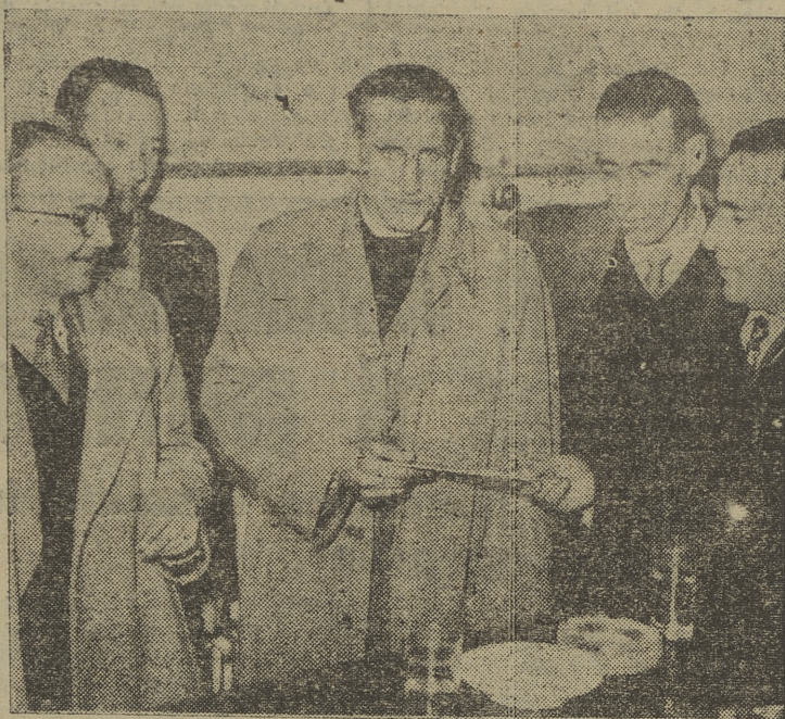
El afortunado ganador en el momento de recibir el cheque del premio "Inter".

Los montañeros burgaleses, siguiendo sus excursiones preparan una a Quintanar de la Sierra, para mañana, con salida a las siete cuarenta y cinco, del lugar acampado. En esta excursión se desarrollarán los acostumbrados concursos de escalada, esquí y alta montaña, preparativos de otros de más convergencia.