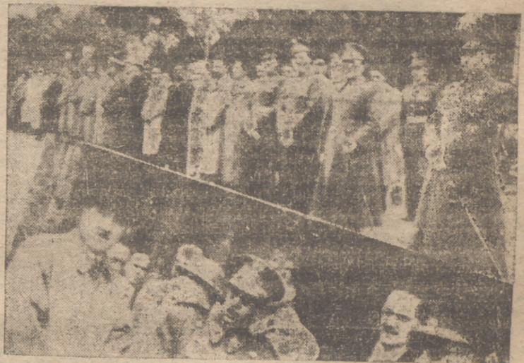
Ayer celebraron su fiesta los caballeros mutilados de guerra por la Patria. En nuestra composición fotográfica aparecen miembros del benemérito Cuerpo y las autoridades que presidieron los actos celebrados. (Información, en segunda página.)

BARCELONA, 24. — Esta mañana, por carretera, ha salido, con dirección a la Rioja, la expedición de técnicos petrolíferos norteamericanos que realizarán exploraciones y sondeos en aquella provincia, en íntima colaboración con el Instituto Nacional de Industria; al