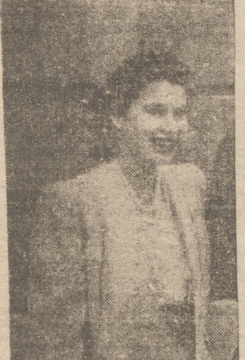
LONDRES. — (Crónica de nuestro corresponsal, GUY BURNON). Isabel II se trasladará el 4 de noviembre, próximo a la antigua

Esto será posiblemente de lo que hablará Isabel II en la apertura del Parlamento