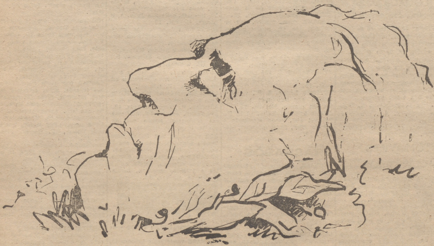
El magnífico pintor burgalés Jesús del Olmo hizo en la capilla ardiente, para nuestro número de ayer, esta última expresión del general Yagüe

Llegamos a San Leonardo. Soria y Burgos están allí. Y está el Gobierno, representado por los Generales y Girón. Otra vez el Ejército y el pueblo. La disciplina el trabajo. Así se llamaba Yagüe. Se deposita el arcón en la iglesia parroquial. Un responso se reza entre lágrimas. Queremos ver. ¿Era nuestro? ¿Era del pueblo? Hay que abrir el arcón. Los arrean los deseos de abrazarlo. Es de la historia, pensamos. Por hombres y mujeres llorando duras penas el cortejo puede prender camino hasta la última morada. En el camposanto, truido por él para la paz del prójimo, reposará su cuerpo. El obispo de Osma inicia el responso. Contesta el coro del Seminario del Burgo. Se oye el cielo. Las voces se repiten en la tejania. Suenan las últimas palabras. Un escalofrío nos electrizó. El responso ya no es oración. Suenan voces de la tierra. Precisamente cuando el cuerpo de Yagüe recibe tierra, empieza a llover. Están llorando el cielo y