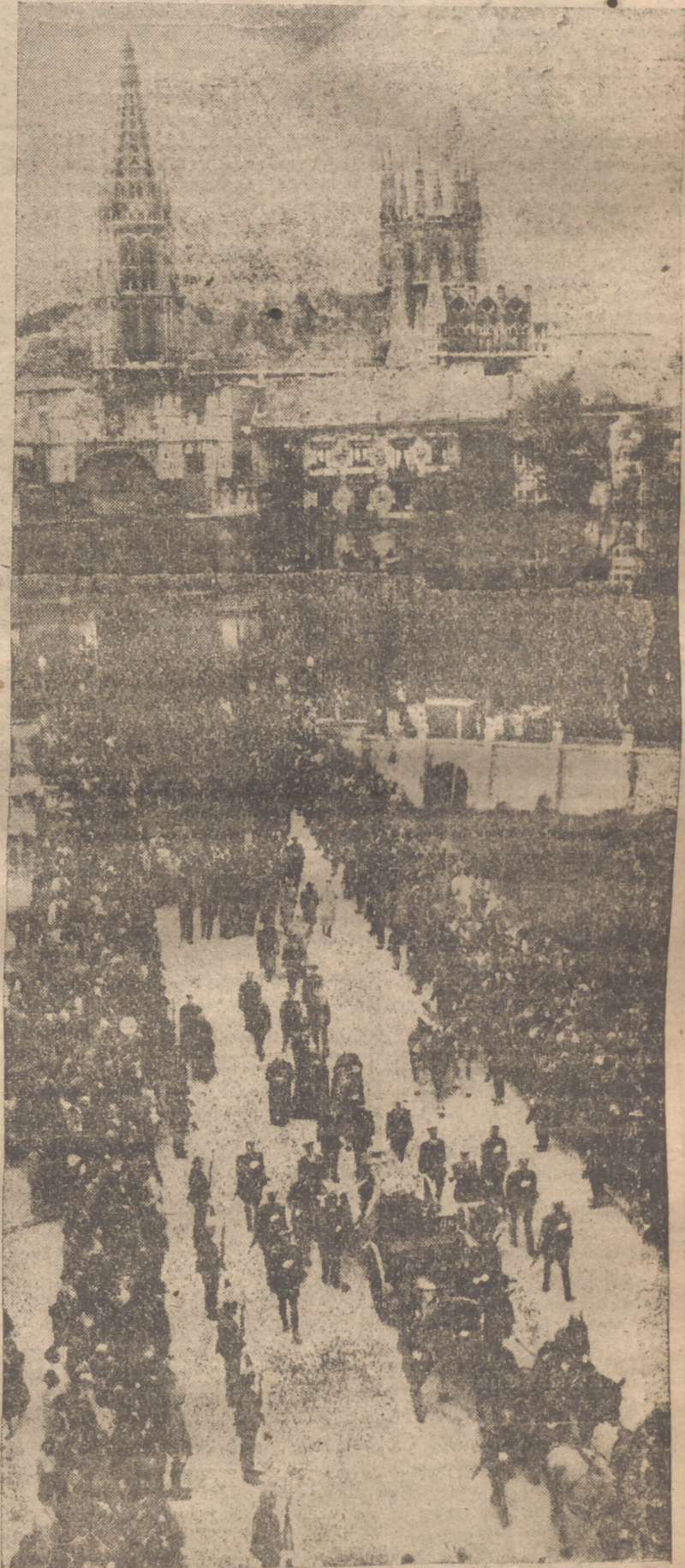
POR EL PUENTE DE SANTA MARIA PASA, ANTE UNA MULTITUD SILENCIOSA, EL CARRO FUNEBRE, TRAS HABER CRUZADO LA CIUDAD

(Amplia información de los actos en las páginas interiores)