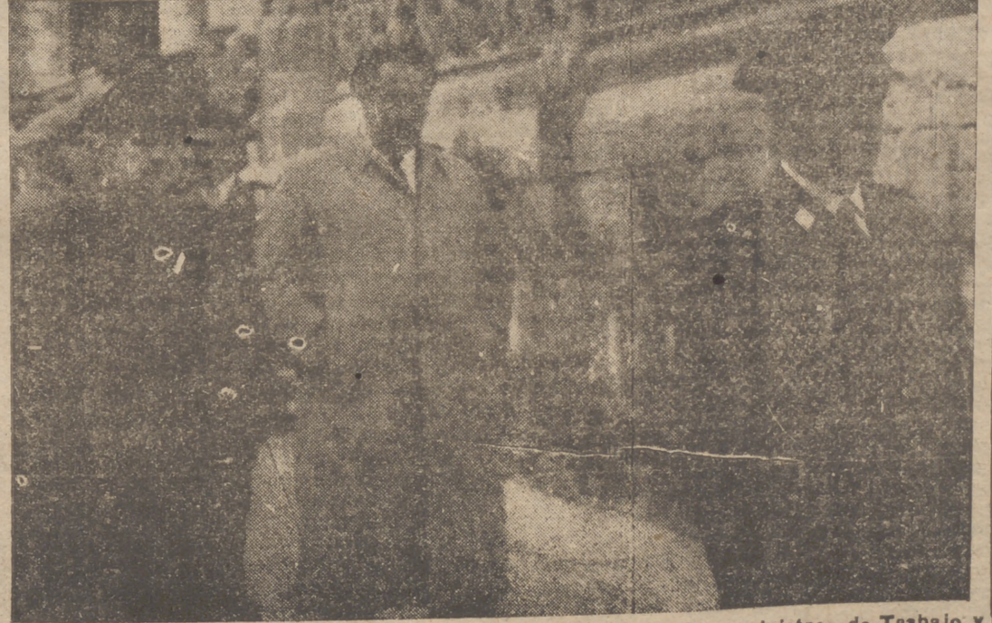
El teniente general Muñoz Grandes, ministro del Ejército, con los ministros de Trabajo y secretario general del Movimiento, forman la presidencia oficial

si no es al enfrentarse con la Muerte, que, vencedora de los vencedores, deja su vida fuera de combate. BONIFACIO ZAMORA