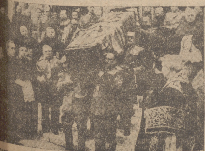
(Cofre de Yagüe)

El Caudillo asciende a Yagüe a capitán general y le concede el título de marqués de San Leonardo de Yagüe