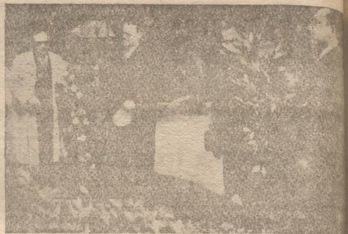
Anteayer, a la salida del funeral celebrado por el alma Excmo. señor don Marceliano Santa María, las autoridades colocaron coronas de flores ante el busto enclavado en el paseo que lleva el nombre del fallecido pintor.

Solicita el Servicio Social en la Escuela de Hogar de la Sección Femenina y así sabrás cumplir el día de mañana tu misión como mujer y esposa.