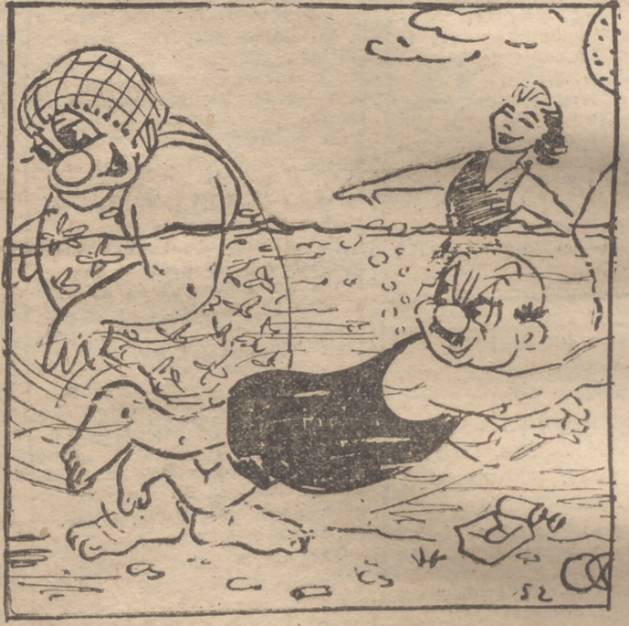
¡A ver si es verdad que eres capaz de estar en el fondo media hora...!