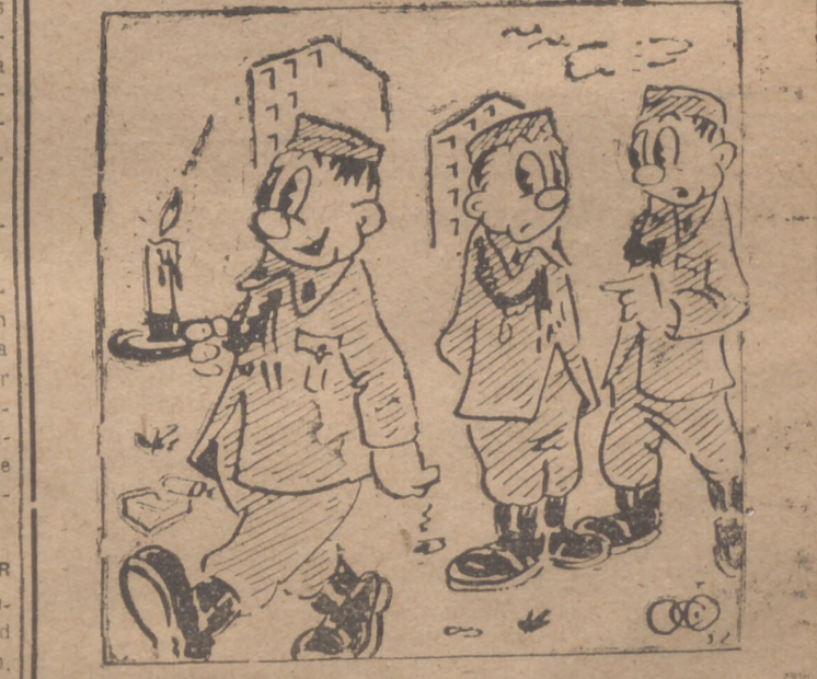
— ¡Dice que le gusta mucho el viento a vela...!