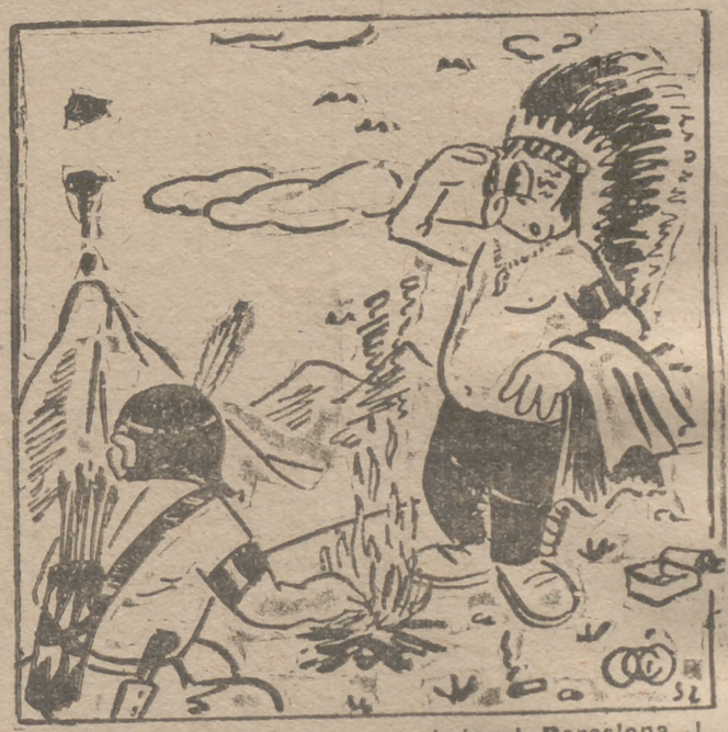
¡Pregunta que cómo ha quedado el Barcelona...!