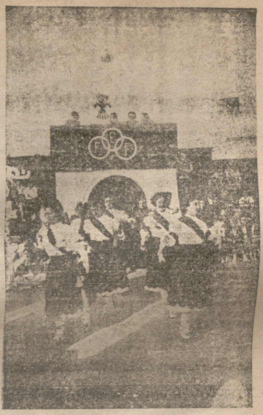
AFILIADAS DE LA S. F. EN LA CIUDAD DEPORTIVA

Entre Washington y Londres ha surgido el problema del mando naval del Mediterráneo. El jefe de operaciones de la Marina norteamericana ha salido para su país, después de conferenciar con los marinos ingleses, sin haber encontrado una solución. Ambos países creen que debe ser uno de sus almirantes el que asuma el mando supremo en este estratégico mar. Eisenhower, que el día 31 dejará su puesto en Europa para trasladarse a EE. UU. para entrar en la batalla política por la presidencia, ha sido informado de las dificultades surgidas entre Inglaterra y Norteamérica, pero se ha negado a hacer comentarios.