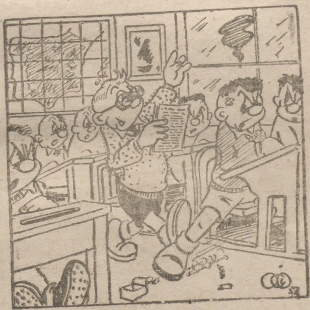
—: Un servidor, si que ha hecho el trabajo que nos mandó...!