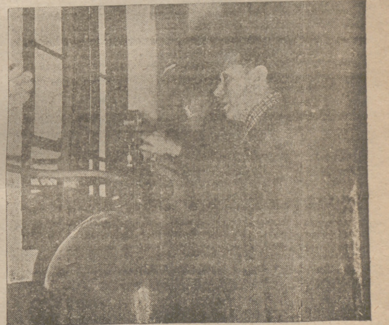
Aparace aquí el rey Jorge VI en una de sus últimas intervenciones oficiales, hace unos días, en Escocia, inaugurando una central eléctrica.