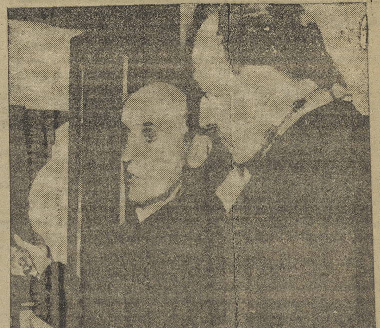
El arzobispo Aloysius Stepinac, al salir de su celda de la prisión de Lepoglava, acompañado por Barnieri, redactor-jefe del diario de Zagreb "Vjennik".

HABANA, 12. — Cuba será representada en el Congreso Eucarístico Internacional de Barcelona por varias peregrinaciones. Una de ellas será presidida por el arzobispo de La Habana, cardenal Arce, quien regresará a Cuba antes de la clausura del Congreso. Los obispos de Pinar del Río, Camagüey, Cienfuegos y Santiago de Cuba presidirán otras peregrinaciones. Numerosos peregrinos harán el viaje a bordo del transatlántico "Constitución", en el cual se alojarán durante su estancia en Barcelona. (Efe).