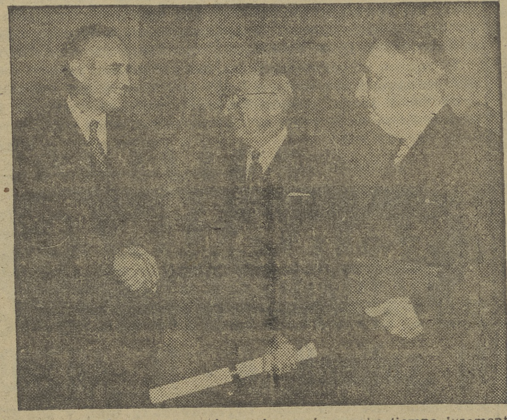
W. Averell Harriman prestó no hace aún mucho tiempo juramento como director de Seguridad Mutua del Programa norteamericano de Ayuda al Exterior. En la fotografía aparece con el presidente Truman (centro) y Fred Vinson (derecha), presidente del Tribunal Supremo de los Estados Unidos.

Y, no obstante, centenares de millones de hombres no ven ni leen un solo periódico.