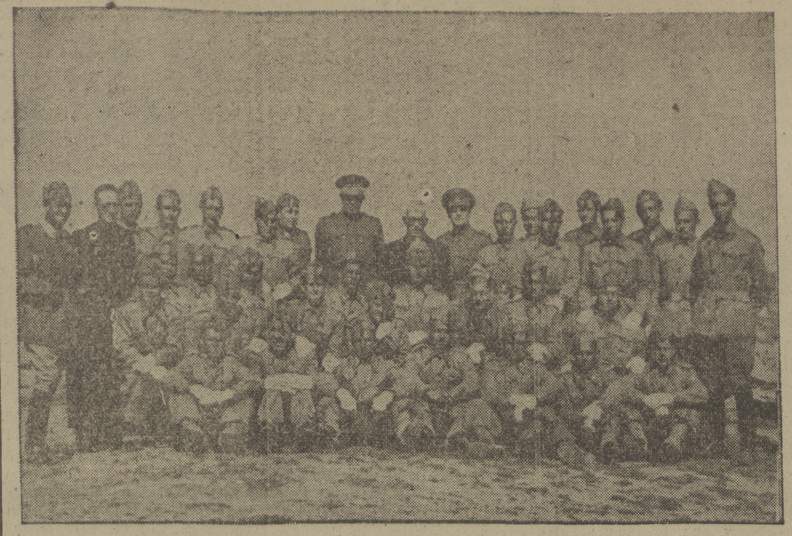
Grupo de soldados del Regimiento de Infantería San Marcial que recibieron la primera comunión el día 19 en el campamento de Cubillo del Campo (Burgos), presidido por el señor coronel, el M. I. S. teniente vicario de la VI Región y demás jefes y oficiales.