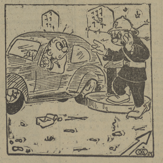
¡Para dar la vuelta no hace falta sacar tanto la mano...!!