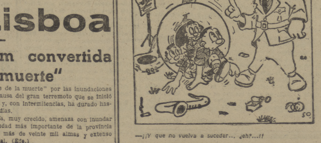
Envío: A la diminuta y simpática banda del F. de J. de Málaga