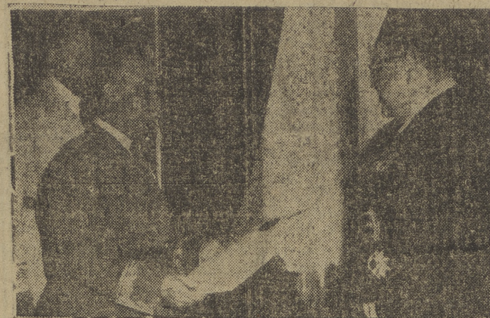
El ministro plenipotenciario de Jordania presenta sus credenciales al jefe del Estado español.

Se intensificarán las relaciones culturales entre España y Jordania