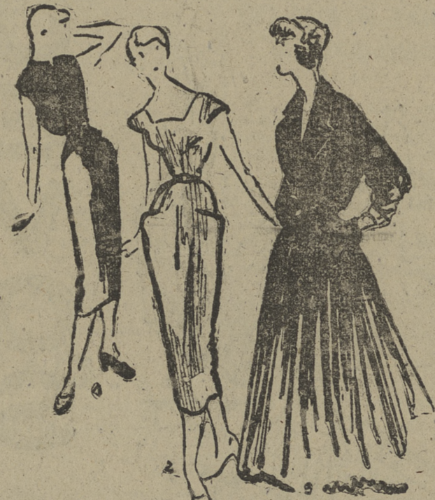
1: Modelo en hania o tricot negro. Escote redondo. Sin mangas. Talle ceñido y falda recta. Cinturón de cuero liso. — 2: Vestido a rayas azul y gris. Gran escote. Mangas exageradamente cortas. Falda tubo con dos amplios bolsillos cortados horizontalmente. — 3: Modelo de jersey azul oscuro. Cuello solapa, cruzado. Manga japonesa, holgada, tres cuartos, ceñida por un puño camisero. Falda pisada de gran vuelo

El precio del kilo de oro fino que, a principios de enero de 1949, se había establecido alrededor de los 800.000 francos y que, a principios de este año, ya se de París a 489.000 francos ha bajado actualmente en la Bolsa de París a 489.000 francos (15 de marzo de 1950). Si nos fijamos en el precio del dólar en esta misma fecha (364 francos), comprobaremos que la