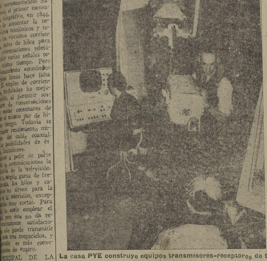
La casa PYE construye equipos transmisores-receptores de televisión en colores. Un momento de las pruebas a través de la N. B. C. de Nueva York

Los programas de televisión, telegramas y conversaciones telefónicas, sin hilos