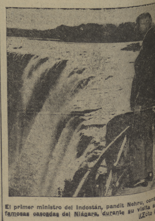
El primer ministro del Indostán, pandit Nehru, contempla las famosas cascadas del Niágara, durante su visita al Canadá.