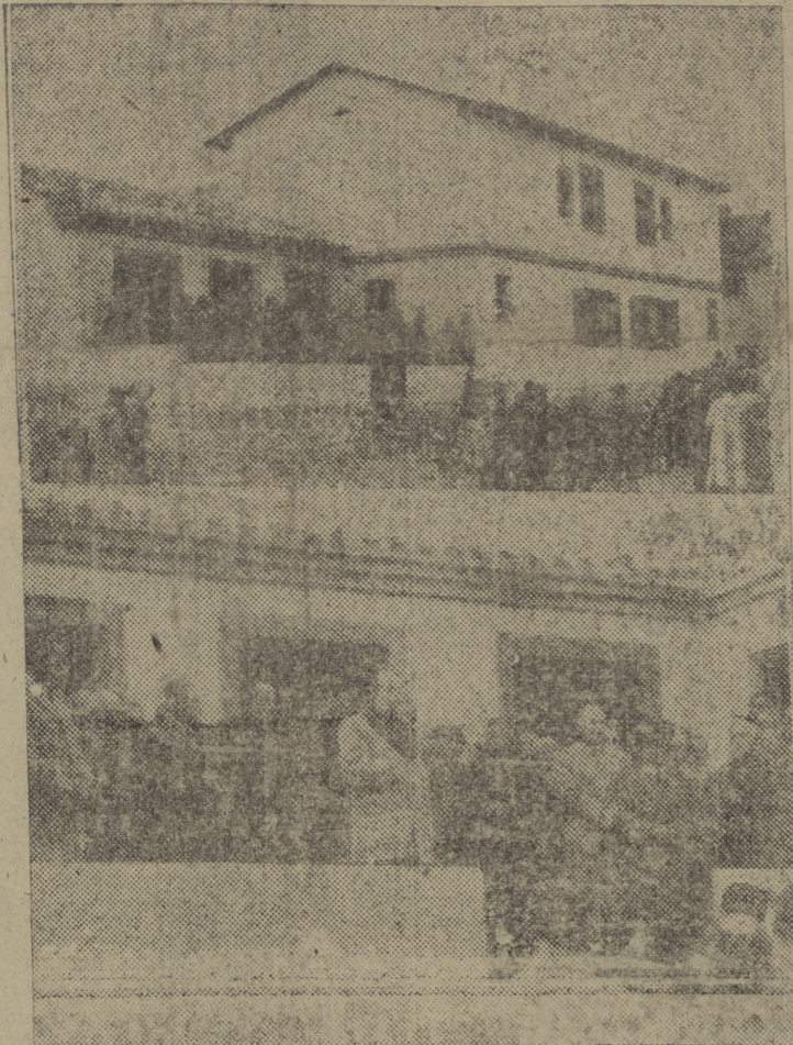
R. de Valcarlos, en el Condado de Treviño Arriba: Una de las obras inauguradas ayer en el Condado de Treviño. — Abajo: El gobernador civil y jefe provincial del Movimiento se dirige al vecindario en el acto inaugural. — Información en páginas interiores.