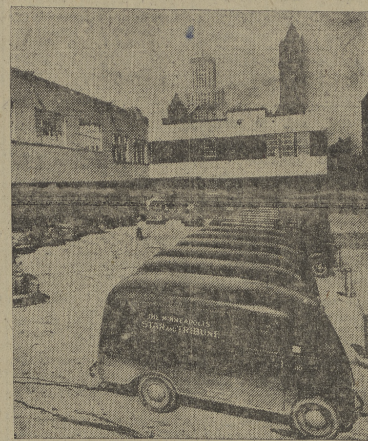
Una flota de 29 camiones y furgonetas regulan el rápido reparto del «Minneapolis Star» y «Tribune», en Minneapolis (Minnesota) y los pueblos adyacentes.

diez camiones adicionales ayudan a la distribución del gran número de ediciones dominicales. Más de 8.000 muchachos provistos de bicicletas llevan los periódicos a las puertas de los 1.500 empleados de la instalación. El edificio tiene un sistema uniforme de alumbrado floresco, excepto en algunos departamentos mecánicos en los que ja ins