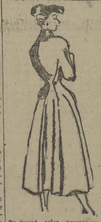
De tweed color naranja es este abrigo que, siendo eminentemente práctico, es también delicadamente femenino y de suave línea. Por de lante cierra con cuatro botones negros de hueso. La espalda lleva dos pliegues profundos que convergen en la cintura en forma de V. Lleva dos bolsillos en las caderas. El color naranja está muy de moda para la calle y deportes.