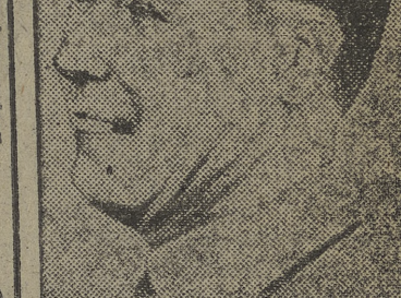
Estos para él tan gratis y honorarios comidos.

Por tal motivo, el doctor Radio piensa solicitar audiencia de Sus Excelencias, para cumplimentar