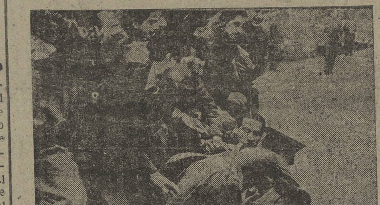
Primera fotografía llegada a España de los disturbios estudiantiles en la capital chilena. En la "foto", lucha de estudiantes y policías.

SANTANDER, 23. — A las seis de la madrugada fué sorprendido en la carretera Burgos-Santander, por agentes del Servicio de Vigilancia Especial de Taxis, un camión de cinco toneladas, matrícula de Bilbao, que transportaba clandestinamente dos mil kilogramos de harina de trigo y mil de trigo, destinados a su venta ilegal.