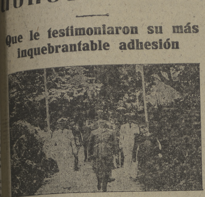
Excelencia el Jefe del Estado dirigiéndose a las Paños de Haya, donde presenció un interesante ejercicio táctico

Que le testimoniaron su más inquebrantable adhesión