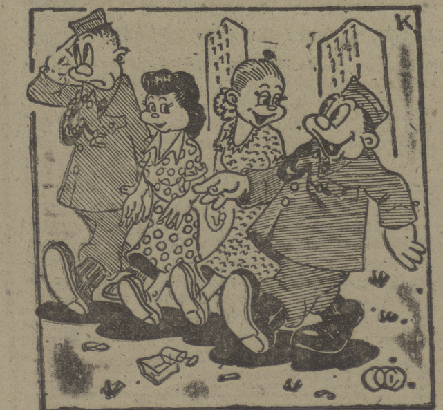
—¡Buenos sois vosotros! ¡Primero, tratéis de agradarnos; más tarde, nos pedís relaciones, y luego... "voláis"! (Cifra.)

Por OCIO ENVIO. — A la Milicia Aérea Universitaria, con todo afecto y simpatía.