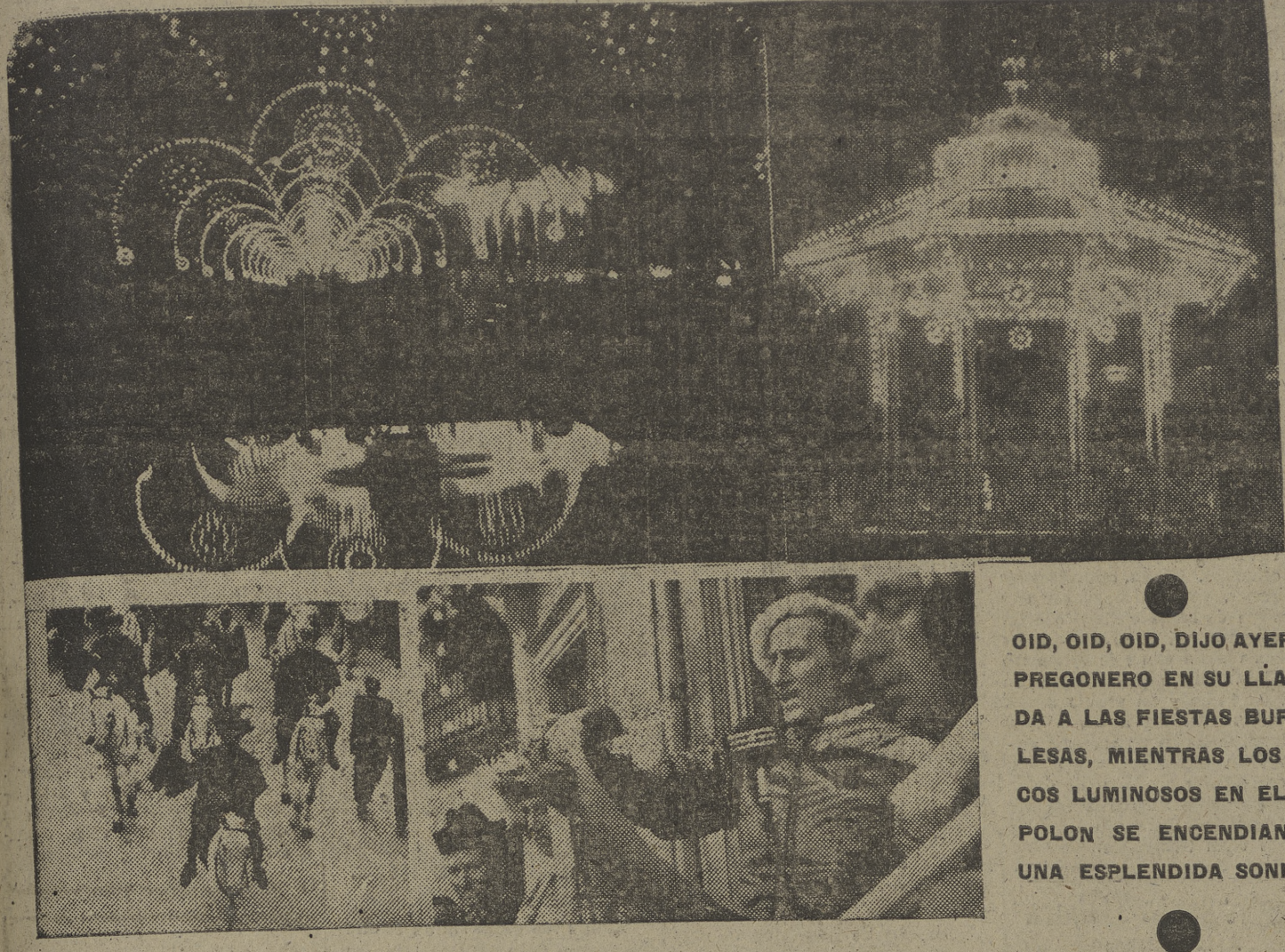
OID, OID, OID, DIJO AYER EL PREGONERO EN SU LLAMADA A LAS FIESTAS BURGALINAS, MIENTRAS LOS ARCOS LUMINOSOS EN EL ESPOLON SE ENCENDIAN EN UNA ESPLENDIDA SONRISA.

VIENA, 26. — El arzobispo primado de Checoslovaquia, monseñor Beran, ha enviado a todos los sacerdotes del país el texto de la Santa Sede relativa a la excomunión de todos aquellos católicos que no siguieren las directrices de la Iglesia, y ha advertido al clero que esté a la escucha de Radio Vaticano para recibir por ese medio instrucciones respecto a su misión. Advertia también que no escriban al primado de Checoslovaquia, por estar controlada toda la correspondencia, y que no permitan que les asusten las amenazas. Esta pastoral, que fué leída en todas las iglesias, ha causado sensación en el país, donde se cree que monseñor Beran sufrirá pronto encarcelamiento y sufrirá martirio. La fe en Checoslovaquia se ha robustecido con esta actitud del primado ante sus enemigos. (Efe.)