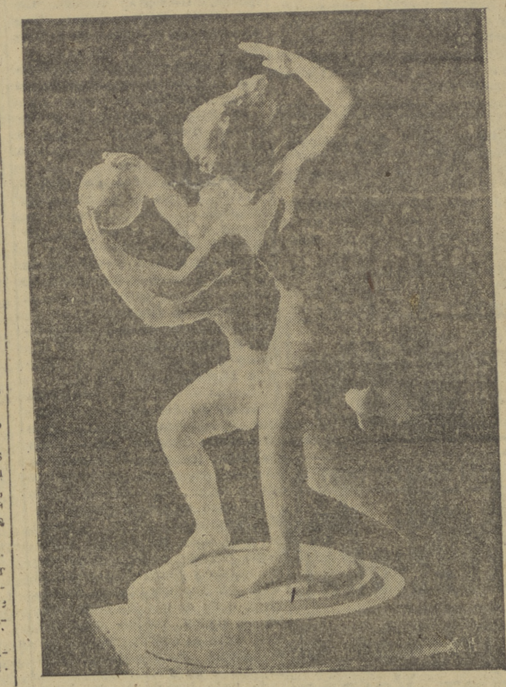
Es el título de este grupo escultórico, obra de Maldarelli, artista norteamericano moderno de carácter permanente, ajeno por voluntad a las modas esotéricas que ahora están en boga. Oronzio Maldarelli es uno de los mejores escultores de la escuela yanqui, de procedencia francesa.