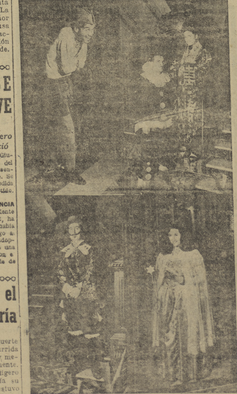
Ofrecemos un reportaje gráfico de Villafranca sobre la fiesta celebrada anoche en el marco surtido y espléndido de la Residencia. Trajes de todas las razas de los tipos, distinguieron en esta reunión llena de encanto y belleza.