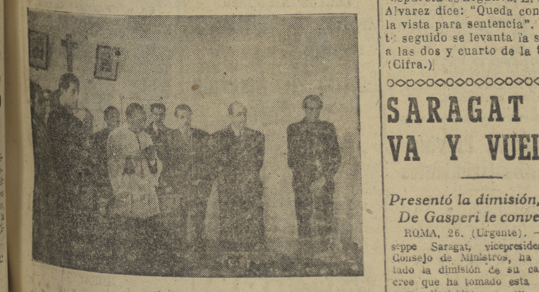
(Información en cuarta página.)

Fué inaugurada ayer por el gobernador civil