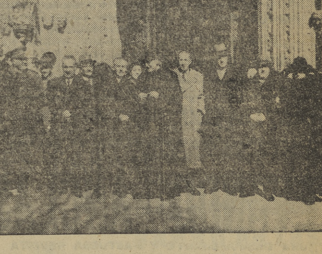
Las autoridades, a la salida del templo de San Lesmes, después de haber oído la misa celebrada con motivo de cumplirse el XLII aniversario de la Ley Fundacional del I. N. P. - Extensa información en cuarta página. (Foto Villafranca.)

SAN MARINO, 26. — Unos cinco mil electores acudirán mañana a las urnas para elegir a los componentes del nuevo Gran Consejo de San Marino. El citado Consejo designa a su vez, anualmente, dos "capitanes regentes", cada uno de los cuales ejerce durante seis meses las funciones de jefe ejecutivo de la República. (Efe.)