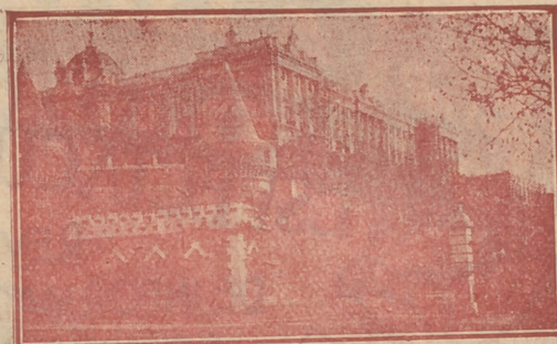
Palacio Real, de Madrid