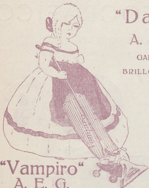
“Vampiro” A. E. G.