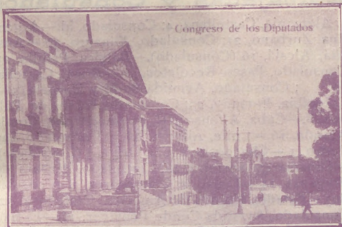
Congreso de los Diputados