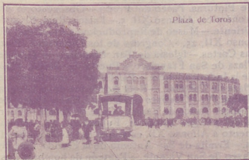
Plaza de Toros

Fabada y pote asturiano TRES CRUCES, 1. MADRID