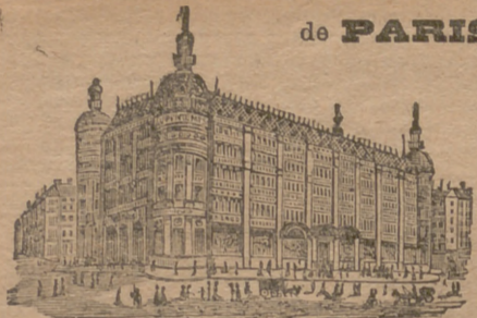
GRANDES ALMACENES DEL