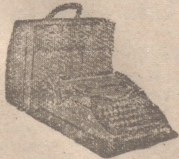
Máquinas de escribir portables y otras marcas