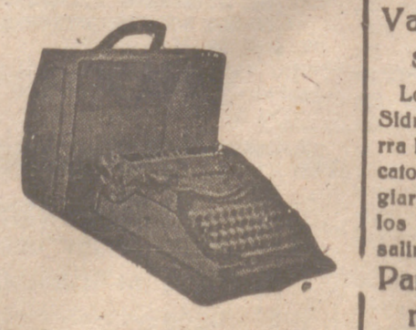
Máquina de escribir portables y otras marcas