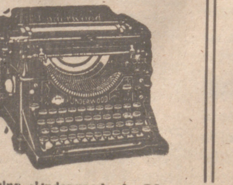
Máquina «Underwood» de Oficina y otras marcas