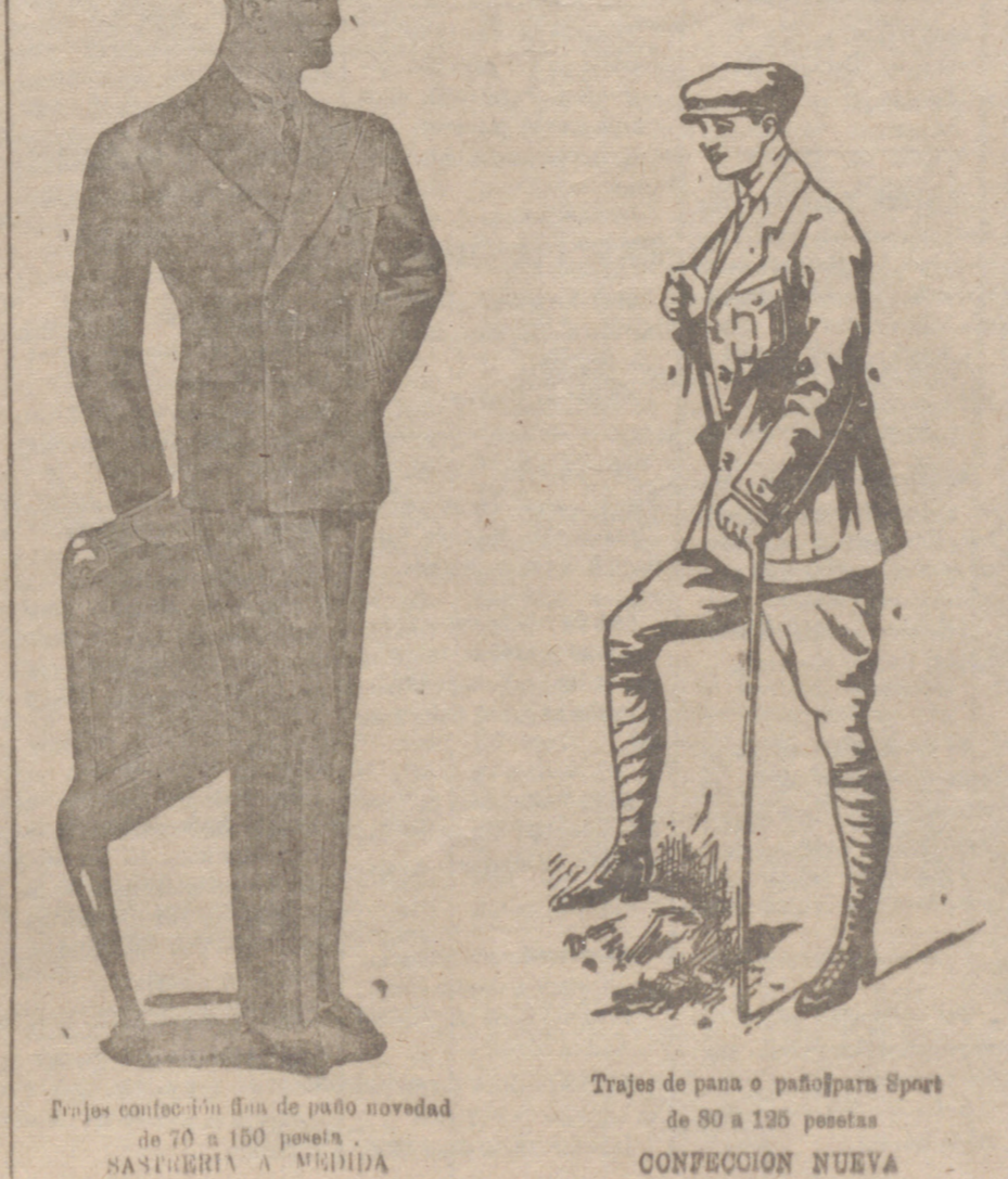
Trajes confeccionados de paño novedad de 70 a 150 pesetas. SANDEBERIA A. MURILLO

Primera casa en conexiones para caballero, señora, jóvenes y niños. Teridos, Pañería y Sestería.