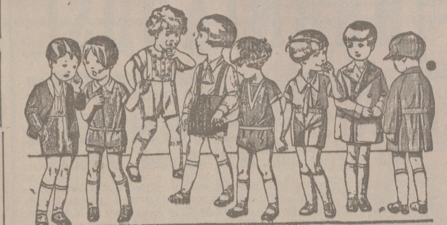
Diversidad de modelos en trajecitos para niños en punto, dril, lana o pana, de 5 a 15 ptas.

Primera casa en confecciones para caballero, señora, jóvenes y niños Tejidos, Pañería y Sastrería