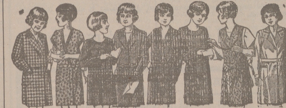
20 modelos distintos en vestiditos para niñas. En percal, de 6 a 10 años, de 4 a 6 ptas. En troyalos, de 6 a 10 años, de 5 a 7 ptas. En crespónes seda, de 6 a 10 años, de 10 a 20 ptas.