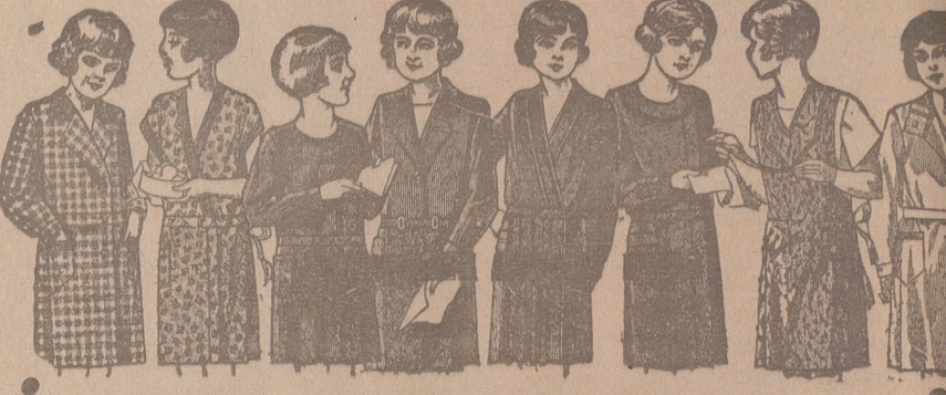
20 modelos distintos en vestiditos para niñas. En percal, de 6 a 10 años, de 4 a 6 ptas. En trovalcos, de 6 a 10 años, de 5 a 7 ptas. En crêpones seda, de 6 a 10 años, de 10 a 20 ptas.

FABRICA DE LIBROS RAYADOS, DIARIOS, MAYORES, COPIADORES, ACTAS, ENCUADERNACIONES, E T C . CAJAS DE CARTON EN GRAN ESCALA Gonzalo Hernando Manrique SUCESOR DE RUFINO S. GONZALO HUERTO DEL REY 2, 4 y 6.—BURGOS