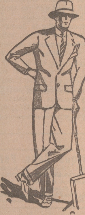
Trajes de paño, confección fina de 60, 70, 80, 100 y 120 pesetas GRANDES SÚRTIDOS

FABRICA DE LIBROS RAYADOS, DIARIOS, MAYORES, COPIADORES, ACTAS, ENCUADERNACIONES, E T C.