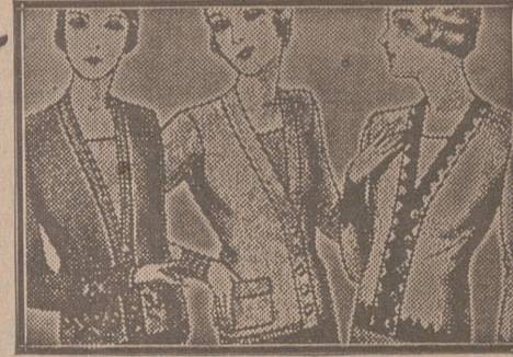
Blusas chaquetillas, de 7, 8, 10, 12 y 15 ptas.