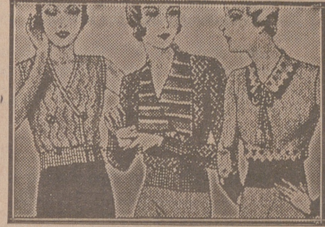
Blusas punto novedad, a 5, 6, 8, 10 y 12 ptas

Primera casa en confecciones para caballero, señora, jóvenes y niños. Tejidos, Pañería y Sastrería