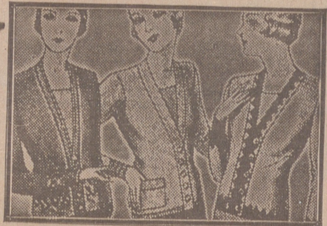
Blusas chaquetillas, de 7, 8, 10, 12 y 15 ptas.