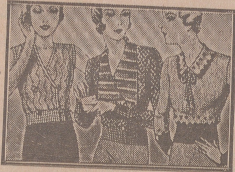
Blusas punto novedad, a 5, 6, 8, 10 y 12 ptas