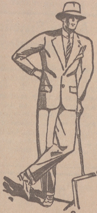
Trajes de paño, confección fina, de 60, 70, 80, 100 y 120 pesetas. GRANDES SÚRTIDOS