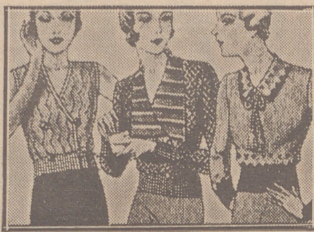
Blusas punto novedad a 5, 6, 8, 10 y 12 ptas.

Primera casa en confecciones para caballero, señora, jóvenes y niños Tejidos, Pañería y Sastrería