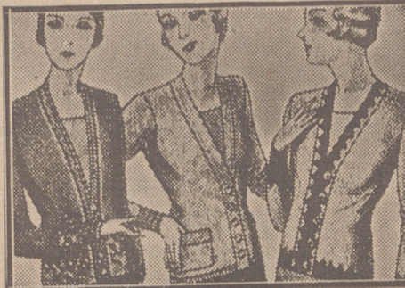
Blusas chaquetillas de 7, 8, 10, 12 y 15 ptas.