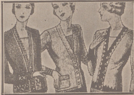
Blusas chaquetillas de 7, 8, 10, 12 y 15 ptas.