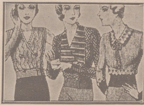
Blusas punto novedad a 5, 6, 8, 10 y 12 ptas.

Casa Munguía Plaza Mayor, 48 y Lain Calvo, 9 Sucursal: Plaza Mayor 5 BURGOS Primera casa en confecciones para caballero, señora, jóvenes y niños Tejidos, Pañería y Sastrería