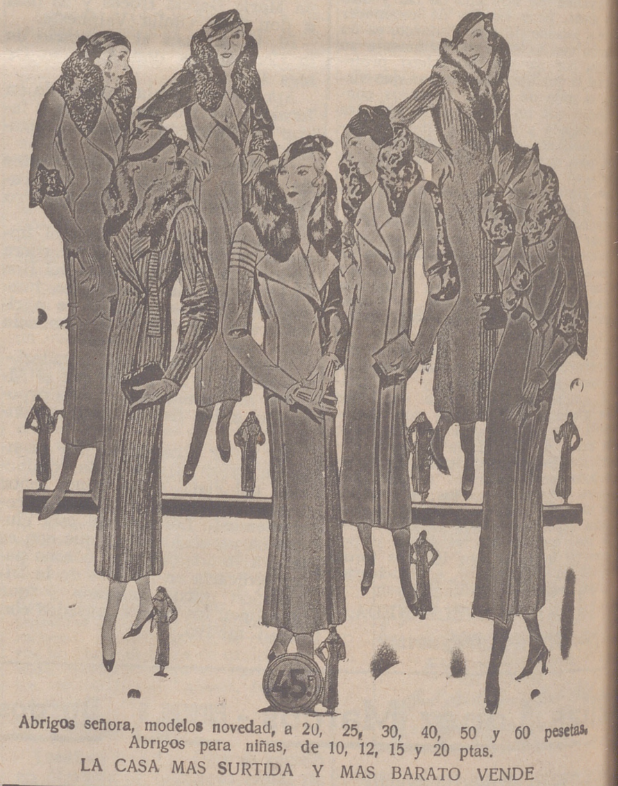
Abrigos señora, modelos novedad, a 20, 25, 30, 40, 50 y 60 pesetas. Abrigos para niñas, de 10, 12, 15 y 20 ptas. LA CASA MAS SURTIDA Y MAS BARATO VENDE

Casa Munguía Plaza Mayor, 48 y Lain Calvo, 9 Sucursal: Plaza Mayor, 5 BURGOS Primera casa en confecciones para caballero, señora, jóvenes y niños Tejidos, Pañería y Sastrería