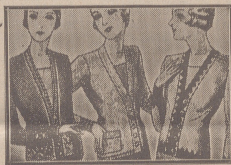
Blusas chaquetillas de 7, 8, 10, 12 y 15 ptas.