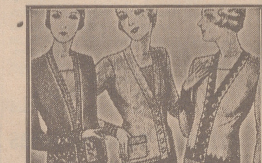
Blusas chaquetillas de 7, 8, 10, 12 y 15 ptas.