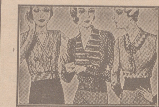
Blusas punto novedad a 5, 6, 8, 10 y 12 ptas.

LOS MEJORES HABANOS "LA EMINENCIA" Pídanlos en todos los estancos.