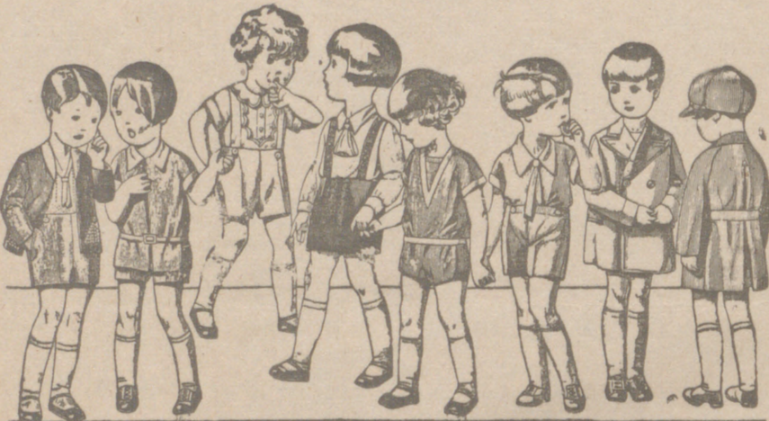
Diversidad de modelos en trajecitos para niños en punto, drill, lana o pana, de 5 a 15 pias.

Primera casa en confecciones para caballero, señora, jóvenes y niños Tejidos, Pañería y Sastrería