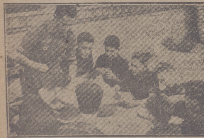
La hora de la comida. Después de bendecida la mesa, los camaradas se disponen a dar buena cuenta de sus raciones y a formar juicio sobre la aptitud del intendente.

Suscribirse a JUVENTUD, semanario de las Juventudes Españolas.