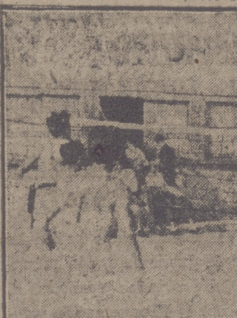
Un detalle del encuentro de balón-volea entre los equipos de Oviedo (al fondo) y Zaragoza, que fué ganado por los asturianos.

corlar. Ganó los dos juegos con los tanteos de 12-3 y 12-6, respectivamente.