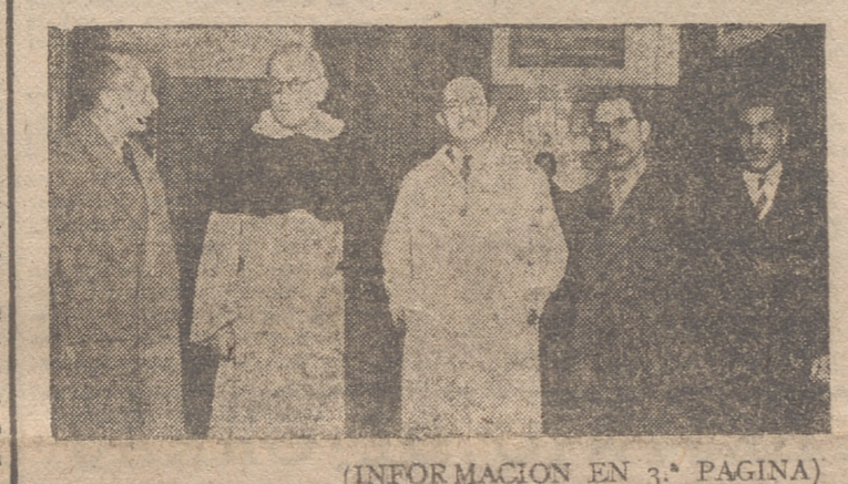
(INFORMACION EN 3.ª PAGINA)