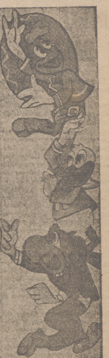
El pato Donald, Joe Carioca y el gallo Panchito, principales intérpretes de la magnífica fantasía «Los tres caballeros».

novia Rosarito. Como en «Los tres caballeros», en este film aparecen perfectamente conjuntados personajes de la vida real.