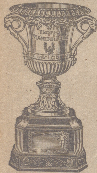
TROFEO MARTINI & ROSSI

Como miembros de la comunidad social sobre la que gravita el duro peso del desequilibrio entre la población y el número de viviendas, hemos de ver con simpatía e ilusión cómo los deseos del pueblo y el propósito del Caudillo hallan intérpretes y ejecutores tan decididos y eficaces como lo es en la esfera sindical esta Obra del Hogar y cómo venciendo las grandes dificultades económicas y la penuria de elementos materiales se pueden contar por millares el número de nuevas viviendas para el pueblo.